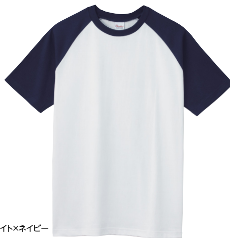
731 ホワイト×ネイビー