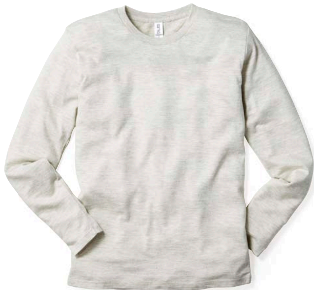
11 OML オートミール