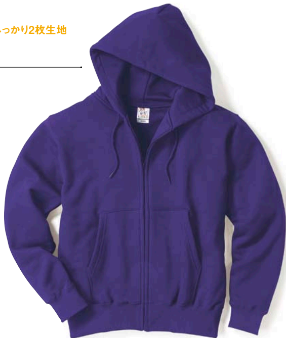
74 DPL ディープパープル