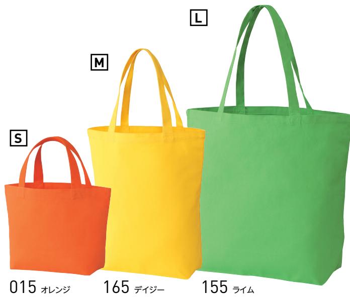
015 オレンジ 165 デイジー 155 ライム

※無漂白商品のため、綿の葉の乾いた破片(黒点)等が含まれております。予めご了承ください。