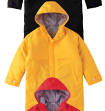
077 ゴールドイエロー